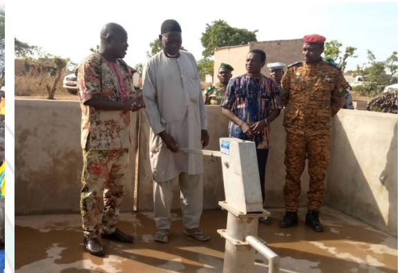
A Kaya et à Fada, les personnes déplacées internes ont bénéficié de forages de la part des FAN