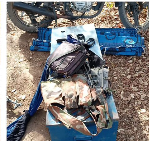
Quelques matériels récupérés sur la base démantelée