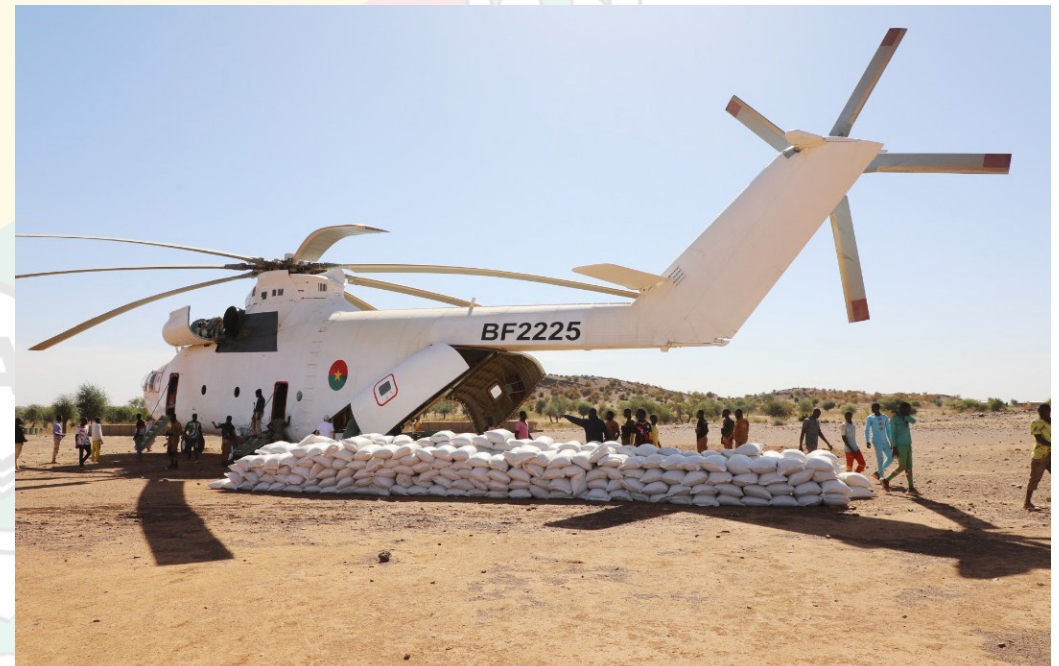
Le ravitaillement de la localité de SOLHAN

Les localités de Solhan, Arbinda, Titao et Sollé ont également été ravitaillées au cours du mois écoulé, ainsi que plusieurs autres localités au Sahel et dans la région de l'est.